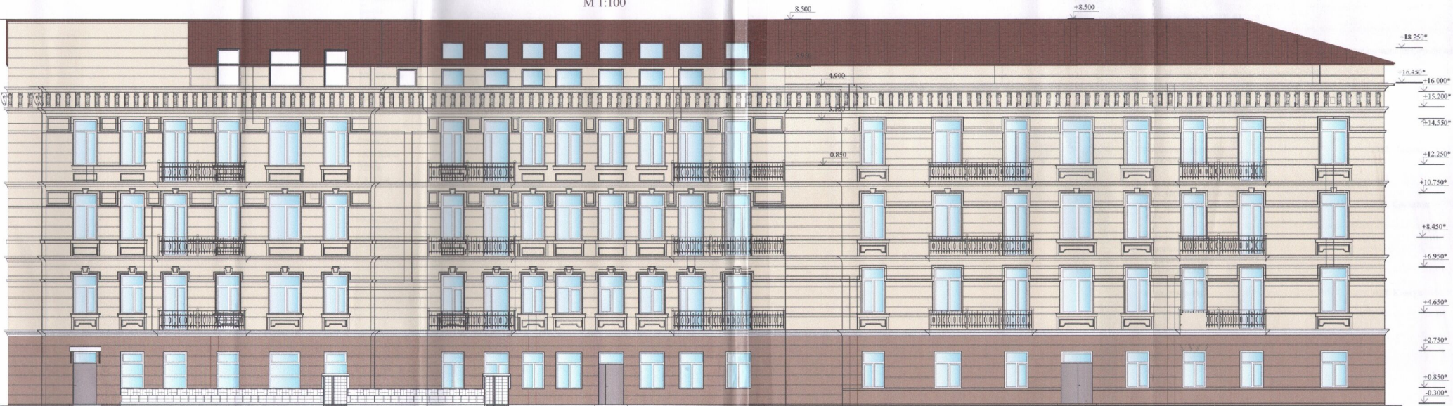
Фасад 9-3 (після ремонтно-реставраційних робіт) М 1:100

В умовах ремонтно-реставраційних робіт всі розміри уточнюються за фактом проведення робіт. За умовою позначку 0.000 прийнято рівень чистої підлоги четвертого поверху. За умовою позначку 0.000* прийнято рівень чистої підлоги першого поверху. Усі висотні відмітки з позначкою **м** вказано від умовної відмітки 0.000* вловж усього фасаду будинку.